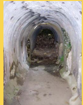
La cisterna romana

Gli ambienti del parco sono caratterizzati dalla presenza o dall'assenza dell'acqua. Un percorso articolato permette di toccarne le implicazioni naturali, storiche e culturali.